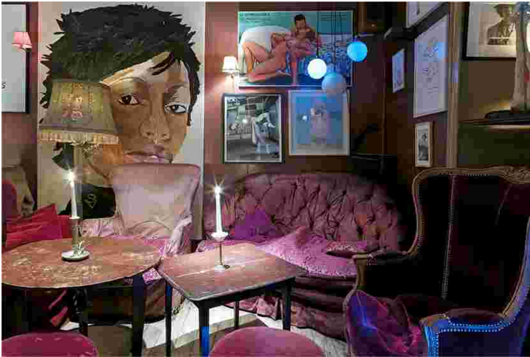
La meilleure jeunesse 58 Rue de l'Aurore, 1050 Bruxelles