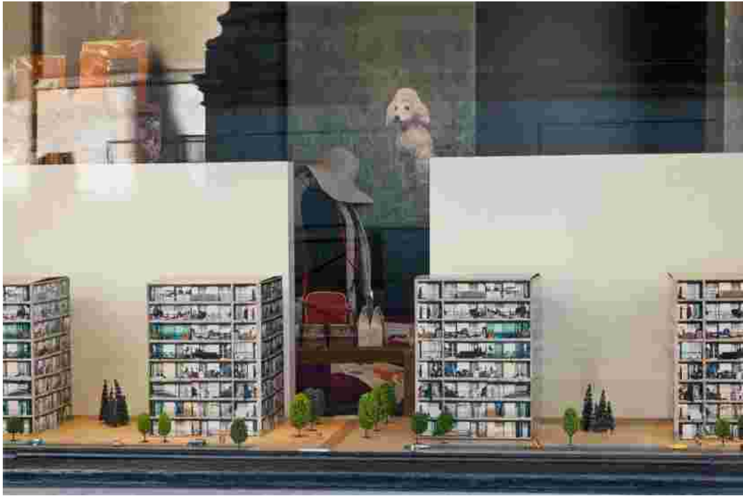
Rose 56 rue de l'aqueduc, 1050 Bruxelles