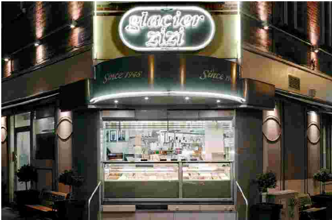
Glacier Zizi 57 /A rue de la mutualité, 1180 Bruxelles