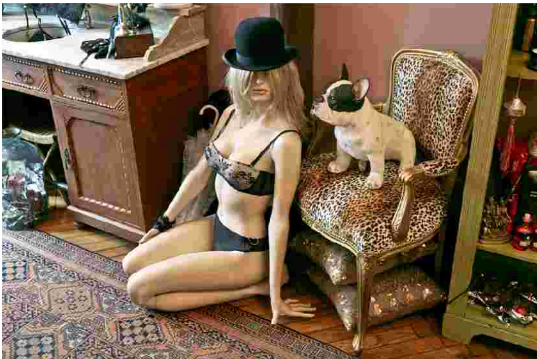
Lady Paname 5 Rue de des Grands Carmes 1000 Bruxelles