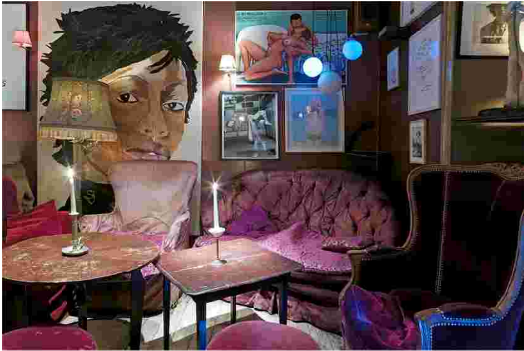
La meilleure jeunesse 58 Rue de l'Aurore, 1050 Bruxelles