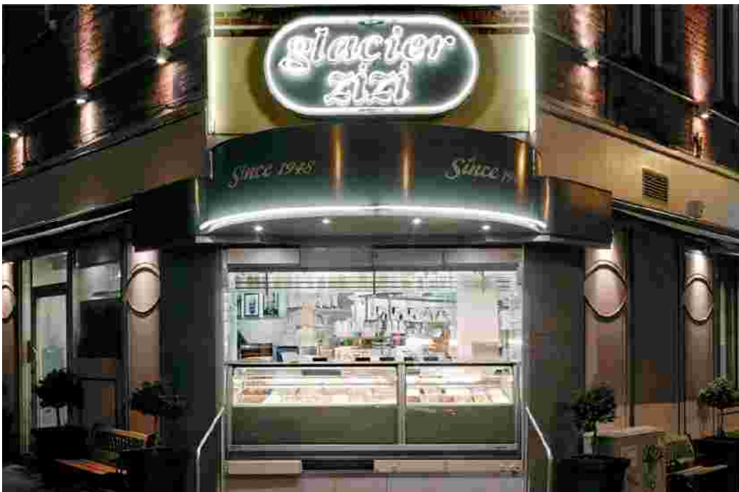
Glacier Zizi 57 /A rue de la mutualité 1180 Bruxelles