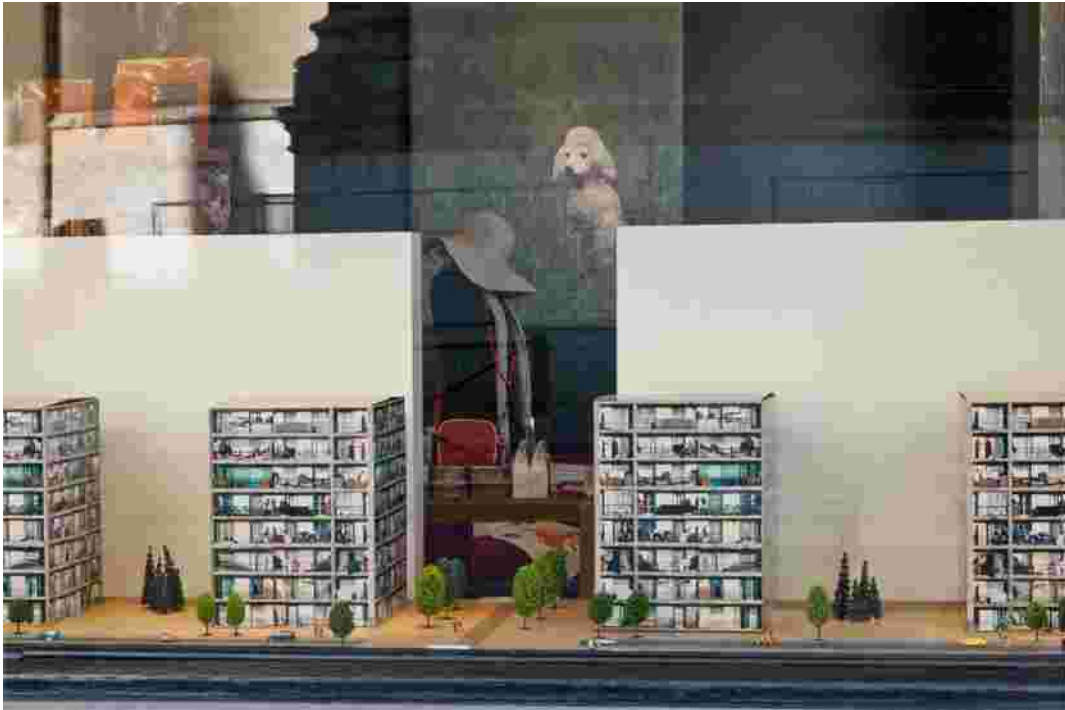
Rose 56 rue de l'aqueduc 1050 Bruxelles