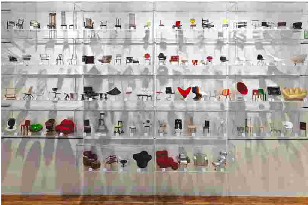
Vitra point 35 Place du Grand Sablon

100 foto's van 100 etalages ... 100 vitrines van een koninklijk Brussel, een gezellig Brussel, een aloud Brussel en hedendaags tegelijkertijd, van een Brussel dat zo menselijk en zo diepzinnig is, zo dichtbij en toch ver af.